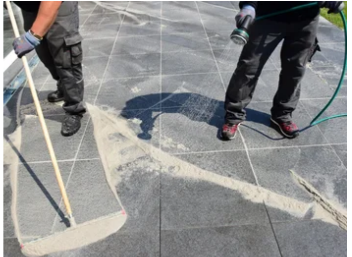
Die Fläche während des Fugens stets feucht halten.