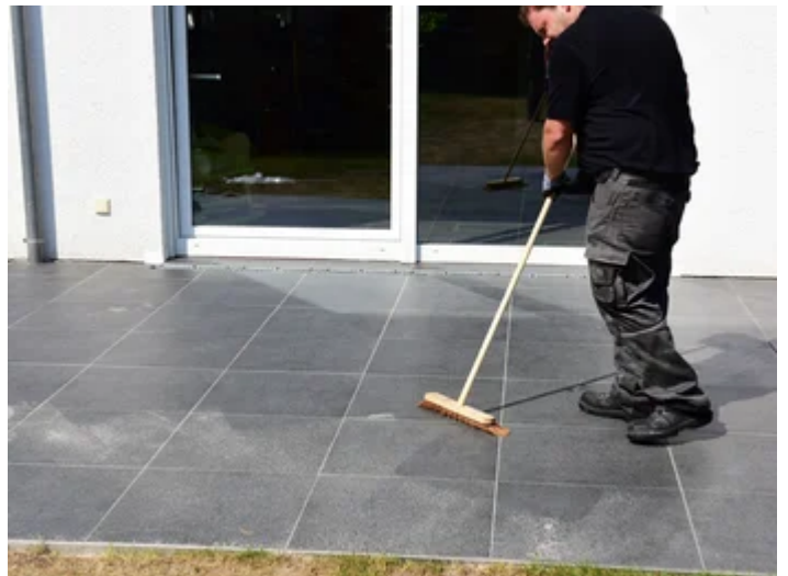
... und Mörtelreste ggf. abkehren.