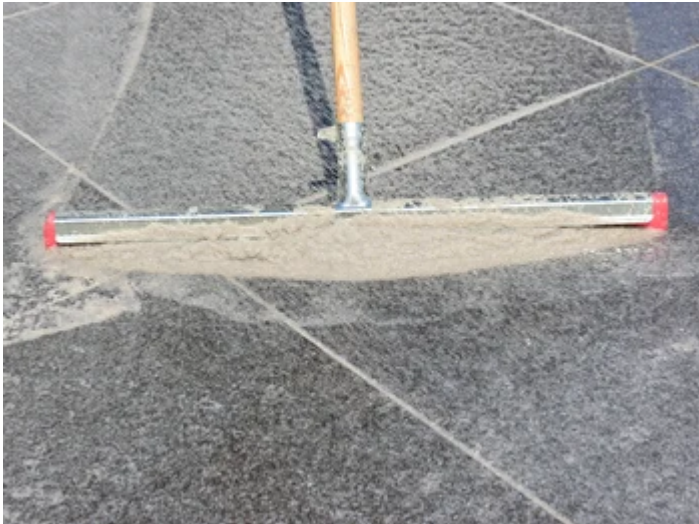
... und mittels Gummischieber in die Fuge einbringen.