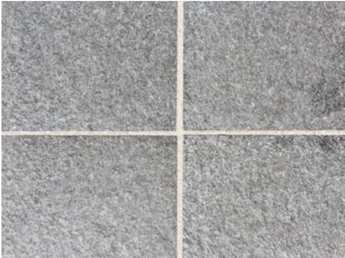
Belagsoptik der Racofix® Terrassen-Schlämmfuge.