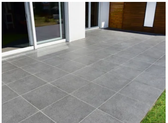
Die verfugte Oberfläche ist nach 24 Stunden begehbar.