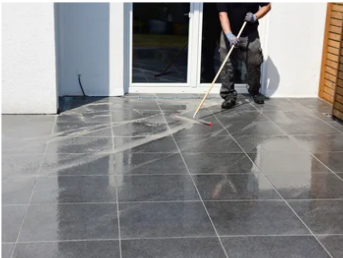
Überschüssigen Fugenmörtel abtragen ...