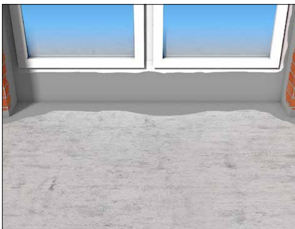
5 Andichten an Fensterrahmen.