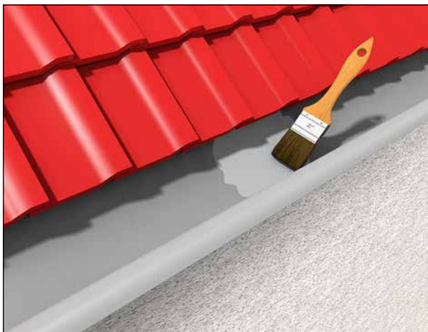
3 Abdichten und Ausbessern von Dachrinnen.