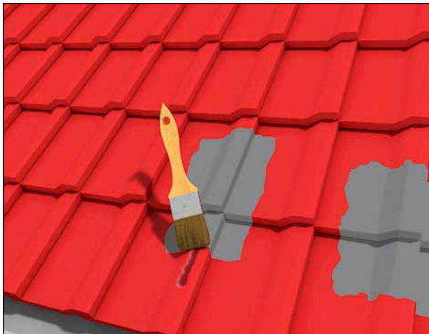
1 Abdichten und Ausbessern von Dachziegeln.