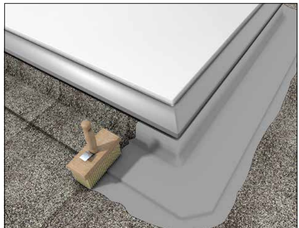
4 Abdichten von Anschlüssen und Übergängen auf Dächern.