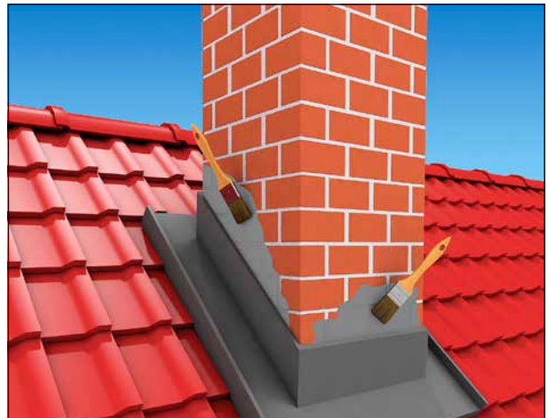
2 Abdichten von Anschlüssen an Schornsteine.