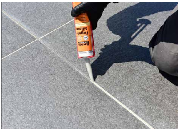
17 Anschluss- und Bewegungsfugen einbringen.