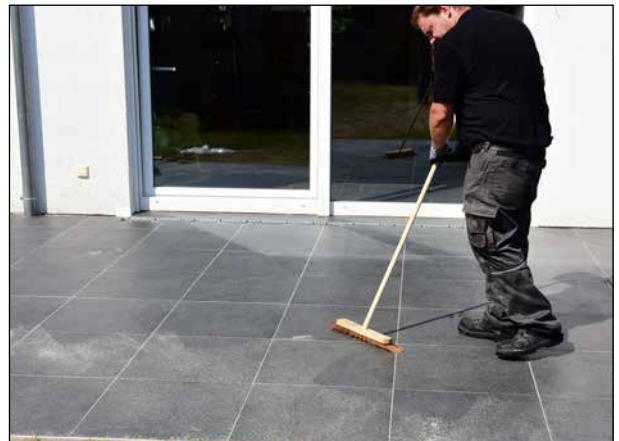
16 ... und Mörtelreste ggf. abkehren.