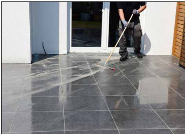
15 Überschüssigen Fugenmörtel abtragen ...