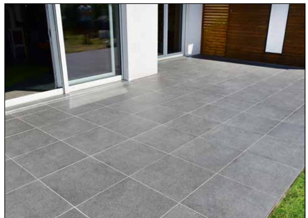
18 Die verfugte Oberfläche ist nach 24 Stunden begehbar.