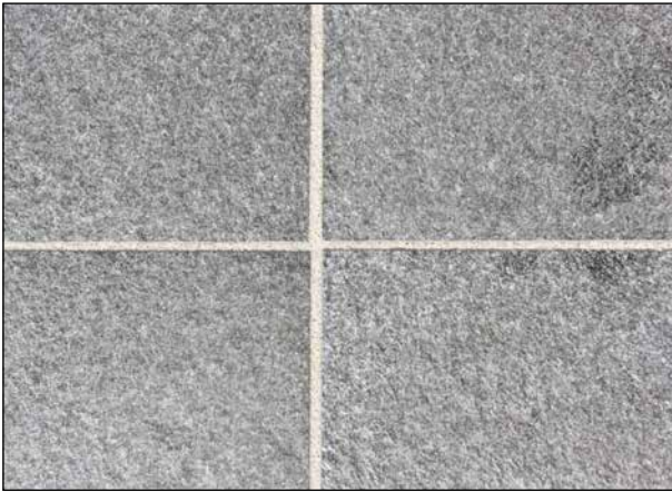
19 Belagsoptik der Racofix® Terrassen-Schlämmfuge.

Sehen Sie hier die Verarbeitung der Racofix® Terrassen-Schlämmfuge.