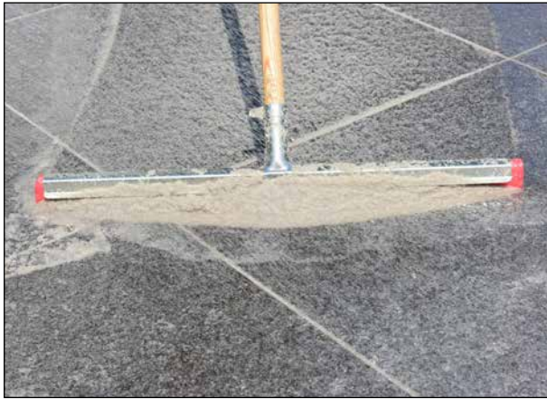
13 ... und mittels Gummischeiber in die Fuge einbringen.