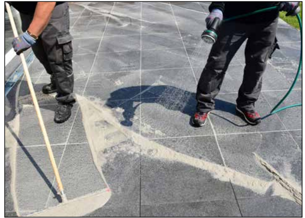
14 Die Fläche während des Fugens stets feucht halten.