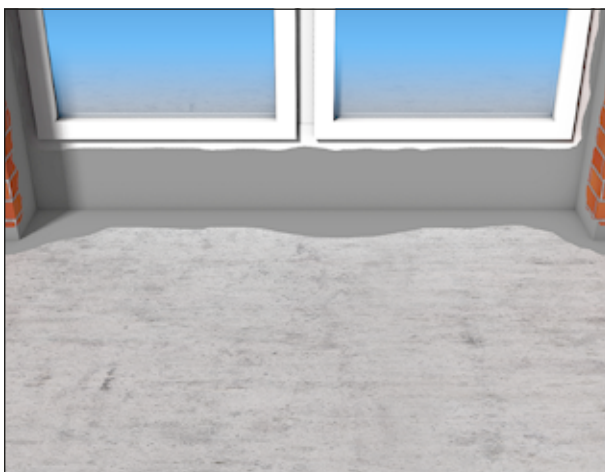
5 Andichten an Fensterrahmen.