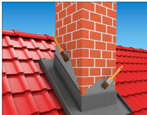
2 Abdichten von Anschlüssen an Schornsteine.