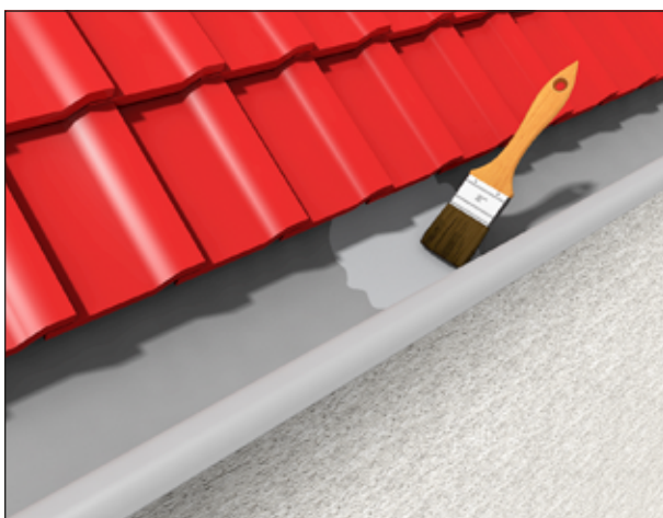
3 Abdichten und Ausbessern von Dachrinnen.