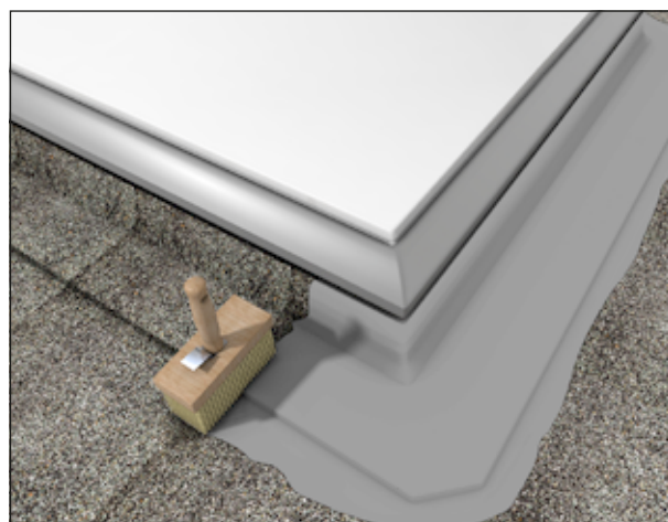
4 Abdichten von Anschlüssen und Übergängen auf Dächern.